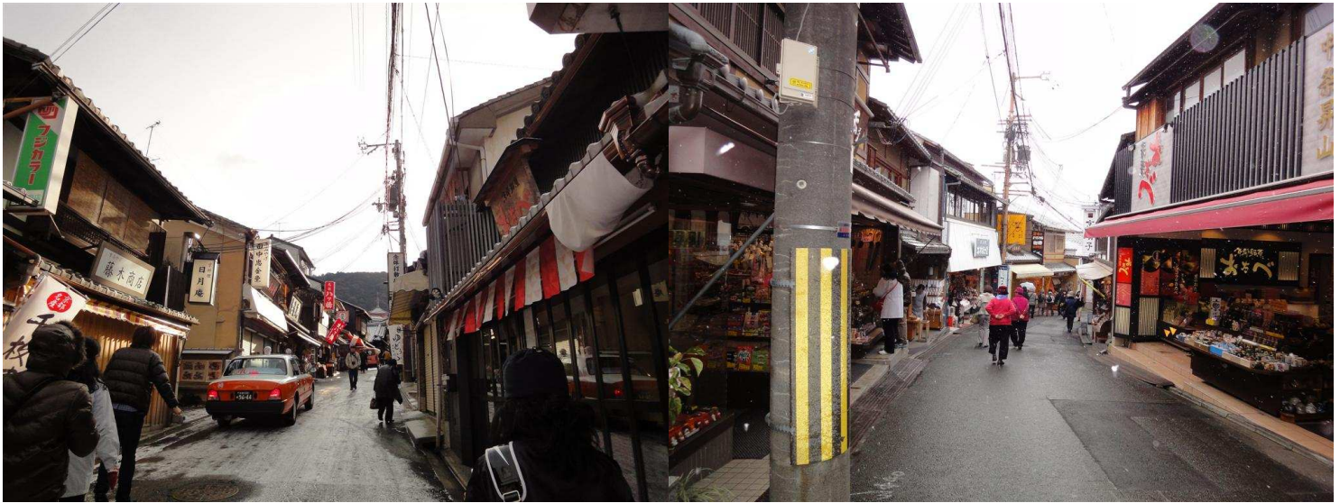
【到清水觀音寺的街景】

到清水觀音寺，一定要走一條長長的商店街。這是第一條讓我讚不絕口的寺院街道。記得第一次看到這條街道時，心中不禁想到，要是每一座寺院都擁有這樣一條獨特風格的街道該有多好！每一個店面都像在說著一個屬於日本的故事，數十個店面說著數十個日本的風情。還沒到清水觀音寺，就被這長長的街景所折服，那是一座怎樣的寺宇，可以有這樣美麗的一路護持？